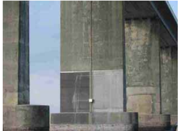
Foto nr. 5 og 6 : Langelandsbroen. Pilotprojekt med katodisk beskyttelse på pille 7 Ø, år 2003.